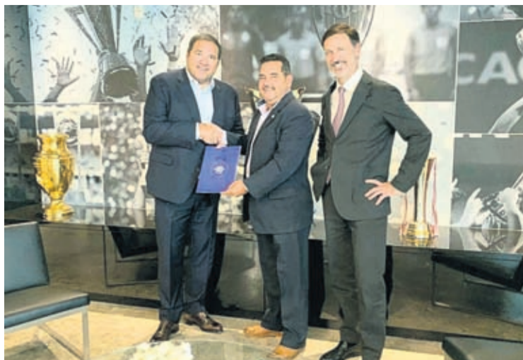
E Presidente y Secretario General di CONCACAF a keda hopi impresiona cu e plannan cu lo yuda AVB de-

Despues cu a lansa e plan na Aruba, awor a entreg'e na CONCACAF, cu a keda masha contento cu e desaroyonan tumando luga na Aruba encuan to futbol y sigur awor cu tin un plan di desaroyo.